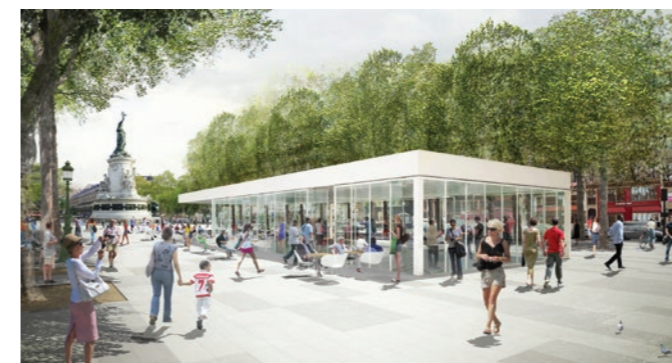
Le café « Monde et Médias » sur la nouvelle Place de la République

Recréer du lien, connecter les habitants entre eux, s'inspirer et utiliser les réseaux sociaux et les nouveaux modes relationnels qu'ils engendrent, favoriser la rencontre et les liens intergénérationnels, la mobilité et la mixité participent plus que jamais au mieux vivre ensemble dans la ville de demain. La ville est réinvestie, réincarnée aussi bien à travers ses habitants que ses nouvelles formes de commerce (« truck commerce », pop up stores, nouvelles zones communautaires). Désormais de nouvelles formes de convivialités s'y inscrivent, modifiant la dynamique des parcours en ville.