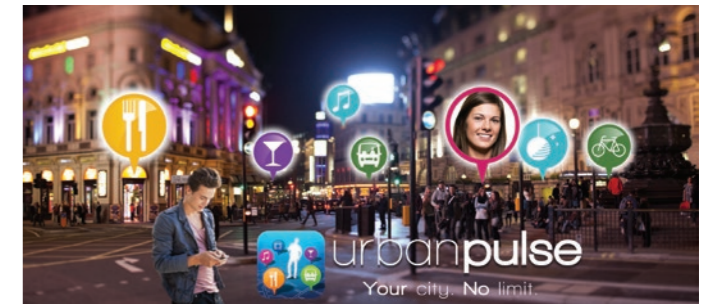
Application Smartphone Urban pulse développée par Véroïa Trandev

Mais comment sortir du règne de l'automobile? Sur les territoires façonnés pour l'usage de la voiture, et plus particulièrement en banlieue dense, quels modes de transport alternatifs proposer? Le vélo électrique en libre-service a par exemple un rôle à jouer pour remédier à l'enclavement de certains quartiers périurbains. L'économie des transports passe également par des formes de circuit court de distribution, comme le système des associations pour le maintien de l'agriculture paysanne, ou AMAP, qui repose sur la confiance et la responsabilité du consommateur. Peut y contribuer aussi l'autopartage qui permet de considérer en ville la voiture comme un instrument collectif de mobilité bon marché plutôt qu'un bien personnel coûteux dont la multiplication est facteur de congestion urbaine. Sur quels autres outils s'appuyer encore pour générer des espaces de proximité dans une économie décarbonée?