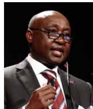
Donald Kaberuka Président de la Banque africaine de développement

Décideurs, financiers et professionnels, africains et internationaux, secteurs public et privé, le AFRICA HEALTH FORUM réunit pour la première fois les plus importants acteurs du secteur de la santé. Il leur offre un cadre de réflexion et d'échange d'expérience propice à la mise en place de partenariats ambitieux et durables. Nous saurons tous, j'en suis certain, tirer parti de cette rencontre pour bâtir ensemble le développement de la filière économique de la santé en Afrique.