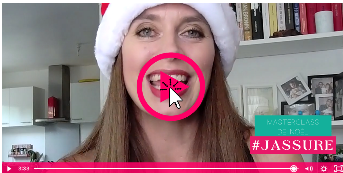
Présentation presse Masterclass 2020

Pour leur permettre d'appréhender cette période difficile sans stress, Sophie Guin met à disposition une Masterclass fin octobre, destinée à toutes les femmes entrepreneures. Composée de webinars, conseils et outils pratiques, elle leur donnera toutes les clés pour se préparer sereinement à l'arrivée des fêtes.