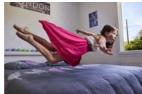
Erine Jouniaux (née en 2002)