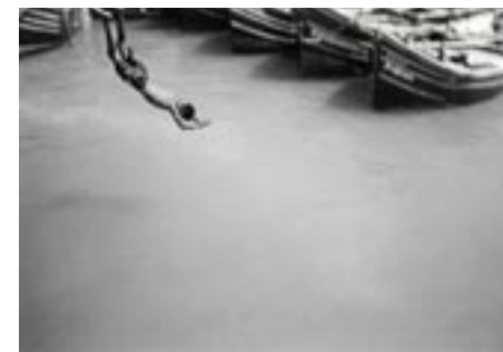
Sofian Boussaid (née en 2002)