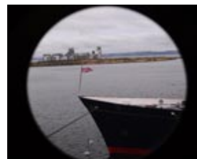
Marina Beudin (née en 2001)